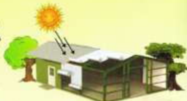
Pemasangan diatas kaso dan reng